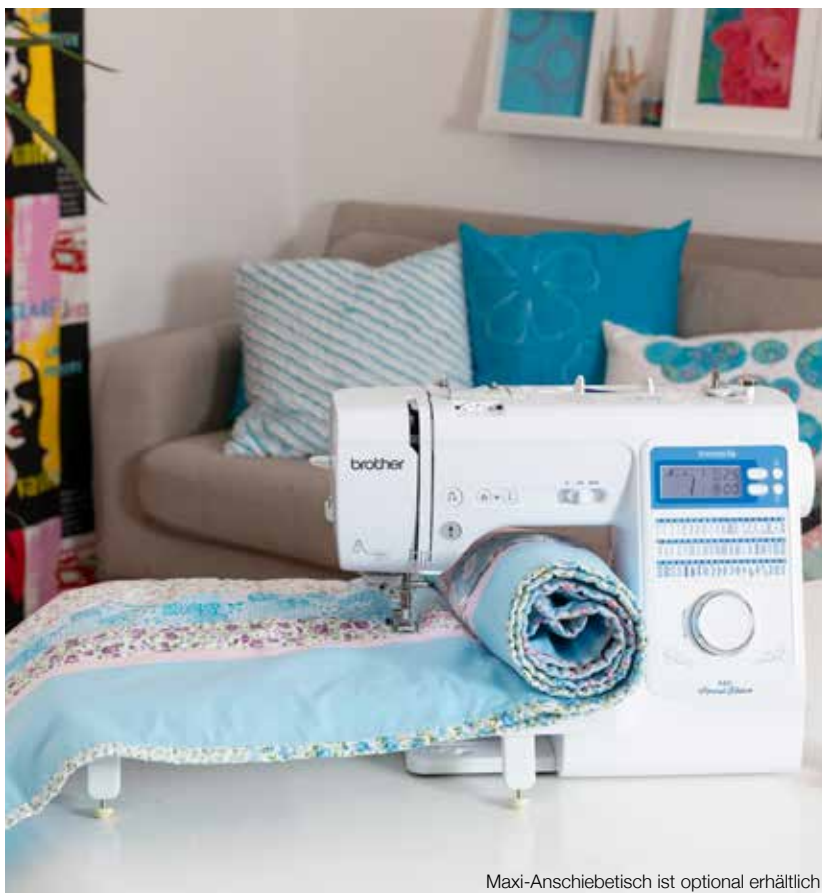
Maxi-Anschiebetisch ist optional erhältlich

Nutzen Sie Ihre Innov-is A60SE noch kreativer. Entdecken Sie das umfangreiche Zubehörsortiment. Damit sind Ihrer Vorstellungskraft keine Grenzen gesetzt.